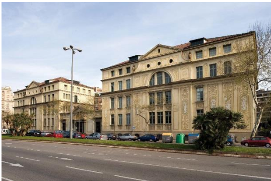
Antes de la intervención

Constructivamente, las fachadas son de obra de fábrica revestidas con mortero de cal y estucadas con gran variedad de esgrafiados debidos a la mano de Francesc Canyellas , íntimo amigo y colaborador del arquitecto Josep Goday i Casals .