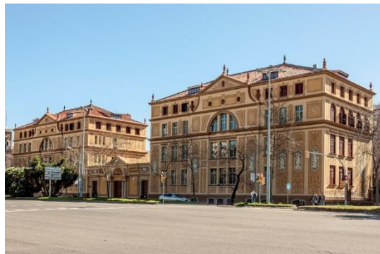
Después de la intervención